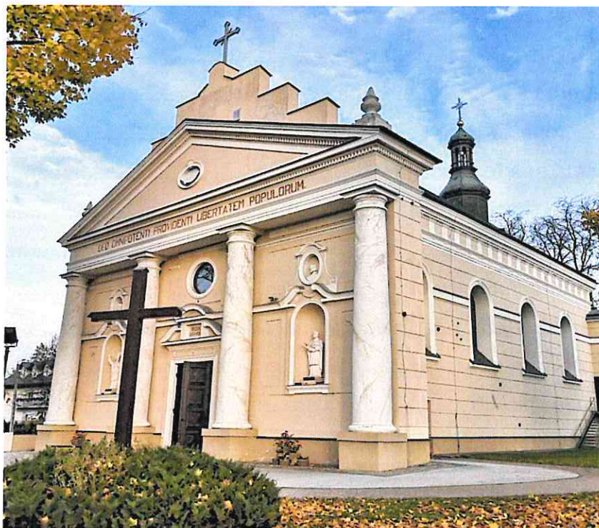
Niedzwica Kościelna 2023